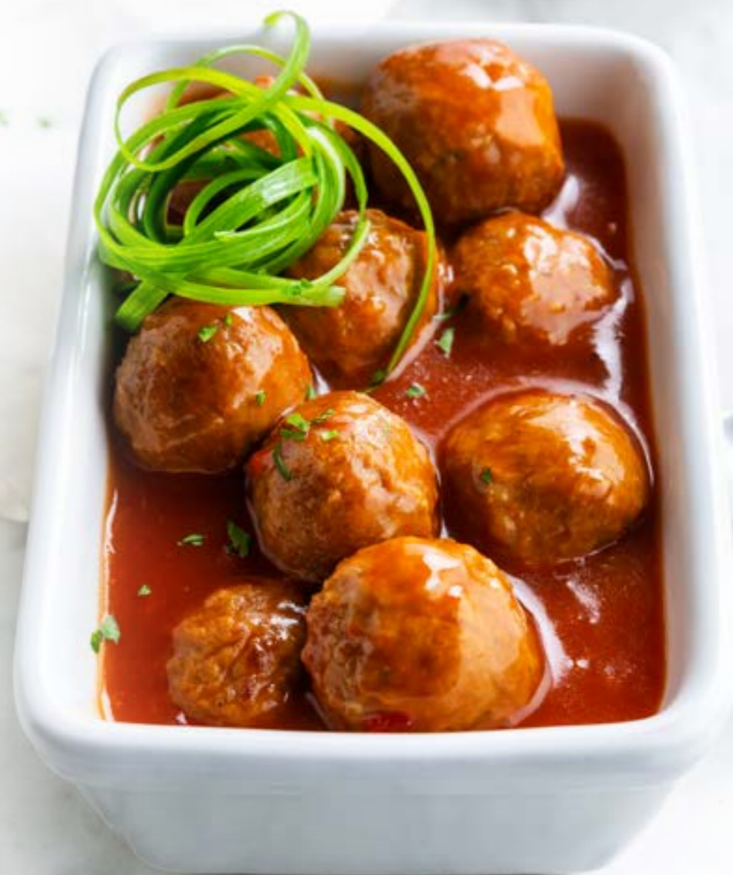
Kippenballetjes in oosterse saus Art. 276