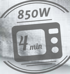
Kippenballetjes in Zweedse saus art. 95827

Overheerlijke Dagschotels snel klaar & voedselveilig