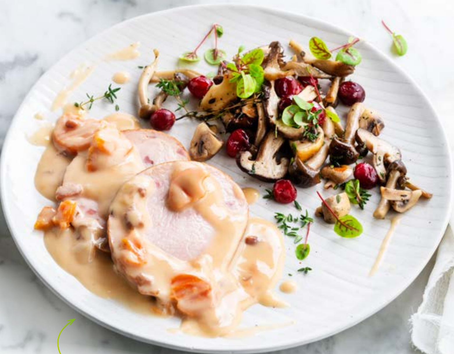
Ardeens Kalkoenfiletgebraad met saus Art. 88627

Volys Culinair met saus Kan het heerlijk gemakkelijker?