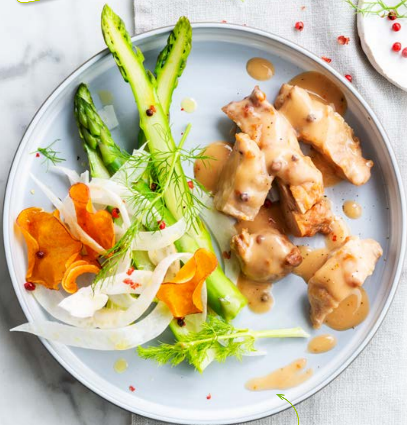
Chickenbites met roze pepersaus Art. 247